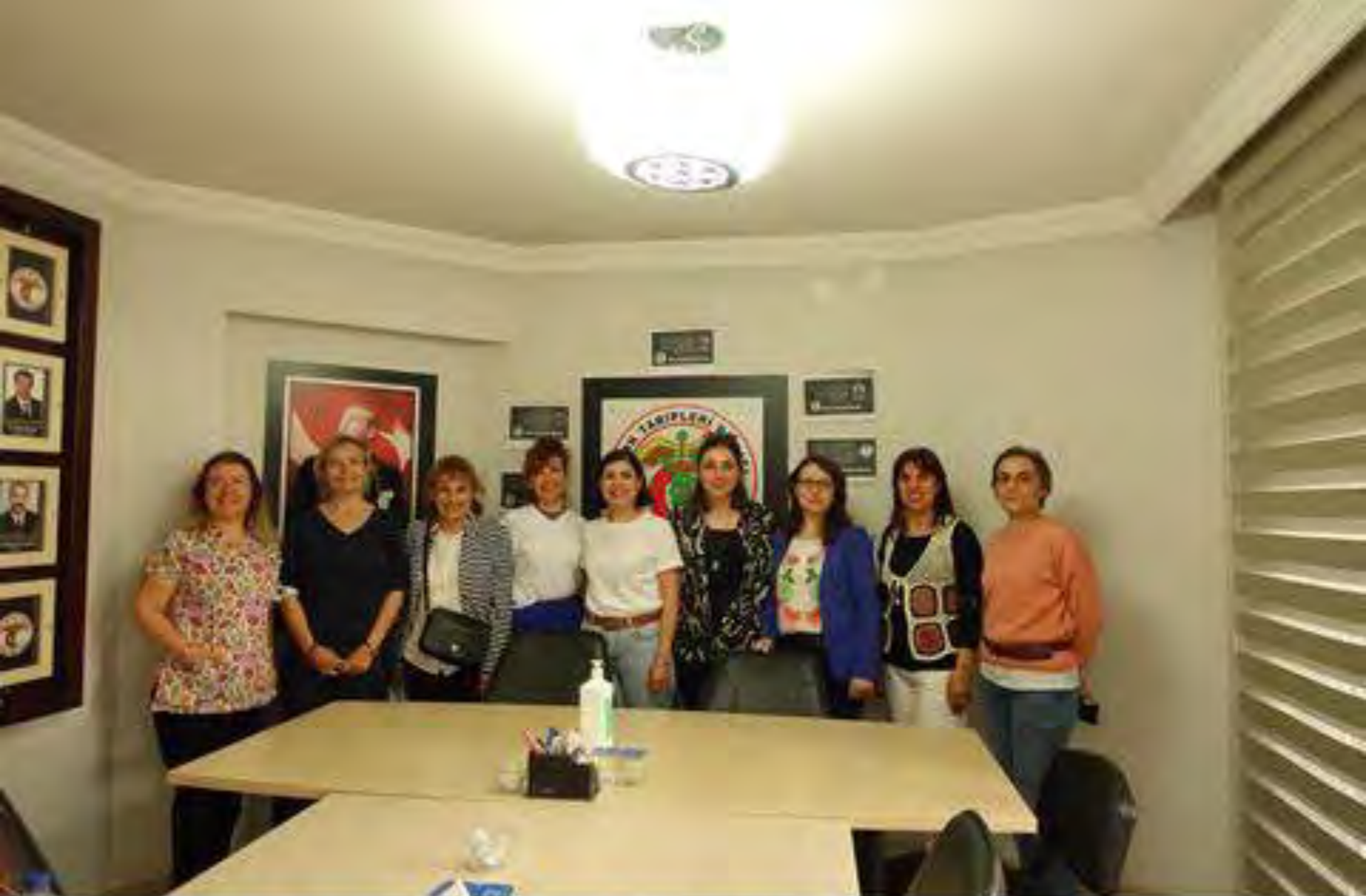
9.5.22 TMMOB VE ATO KADIN KOMİSYON U TOPLANTISI