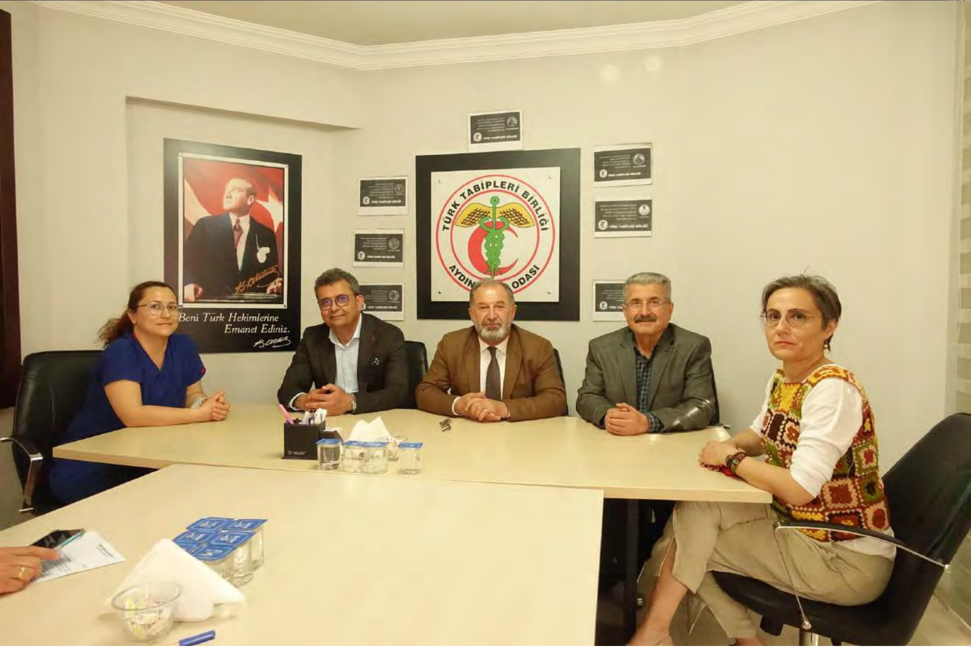
26.04.2022 TUS KADROLARI BASIN AÇIKLAMASI