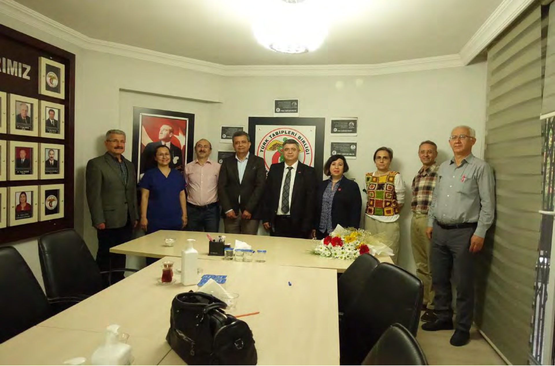
26.04.2022 AYDIN DIŐ HEKİMLERİ ODASI ZİYARETİ