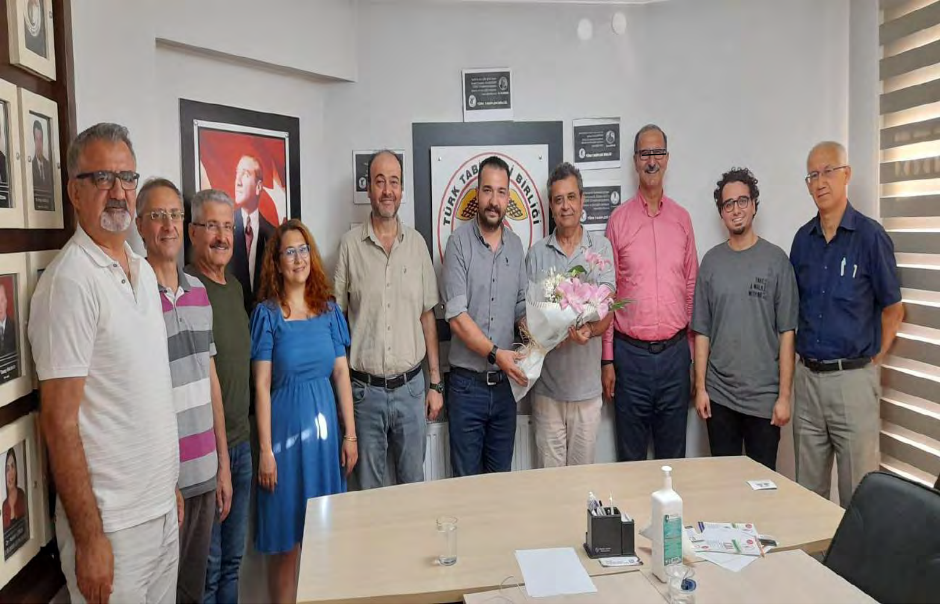
21.06.2022 VETERİNER HEKİMLER ODASININ ZİYARETİ