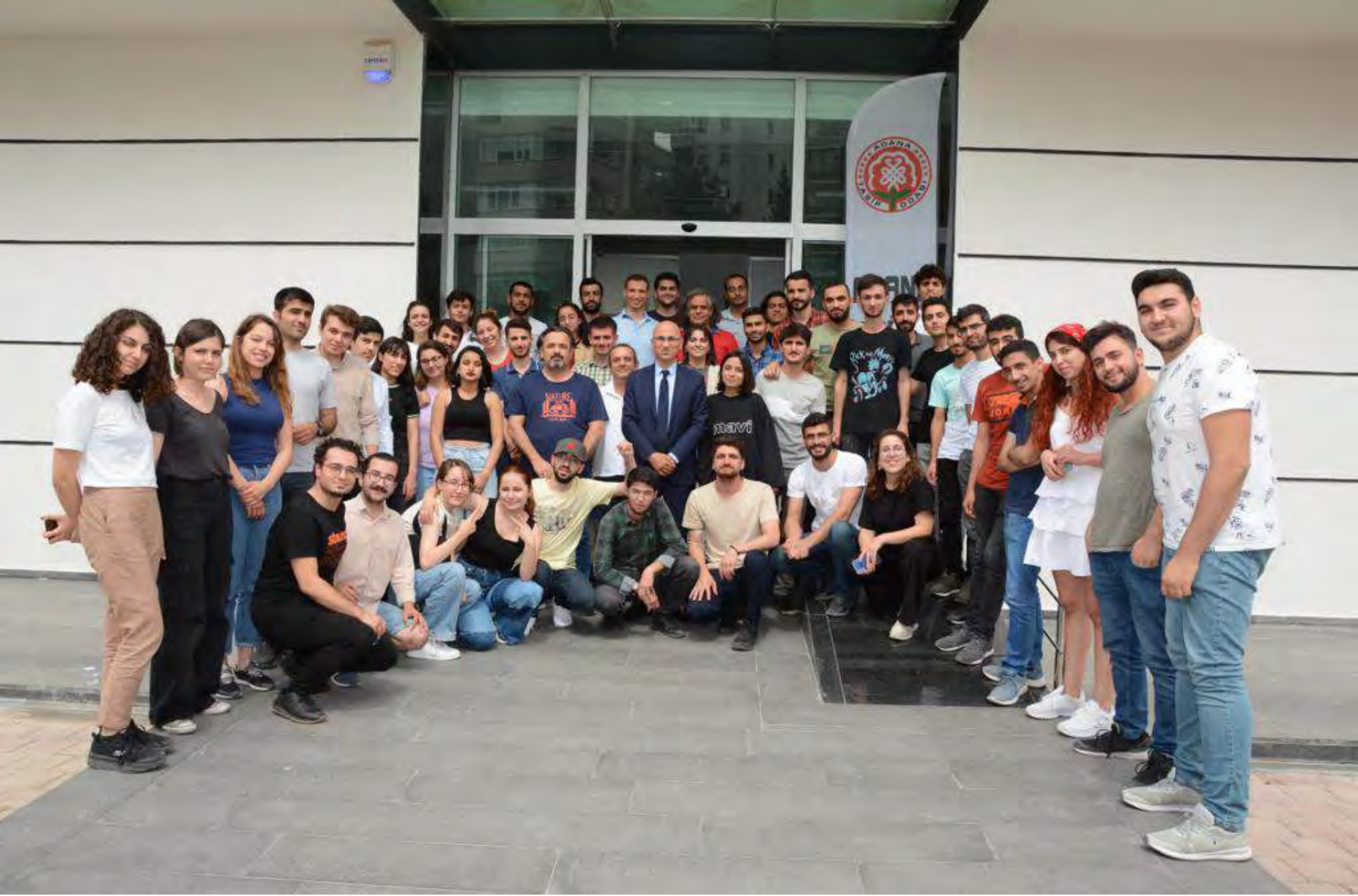
TTB - TÖK 2022 Bahar Okulu 14 -15 Mayıs 2022