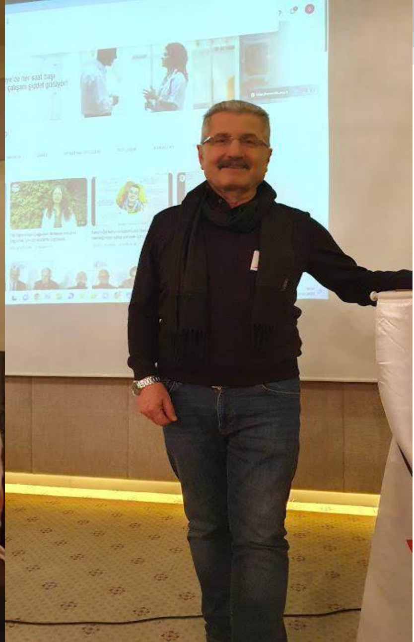
TTB GYK TOPLANTISI 07.01.2023