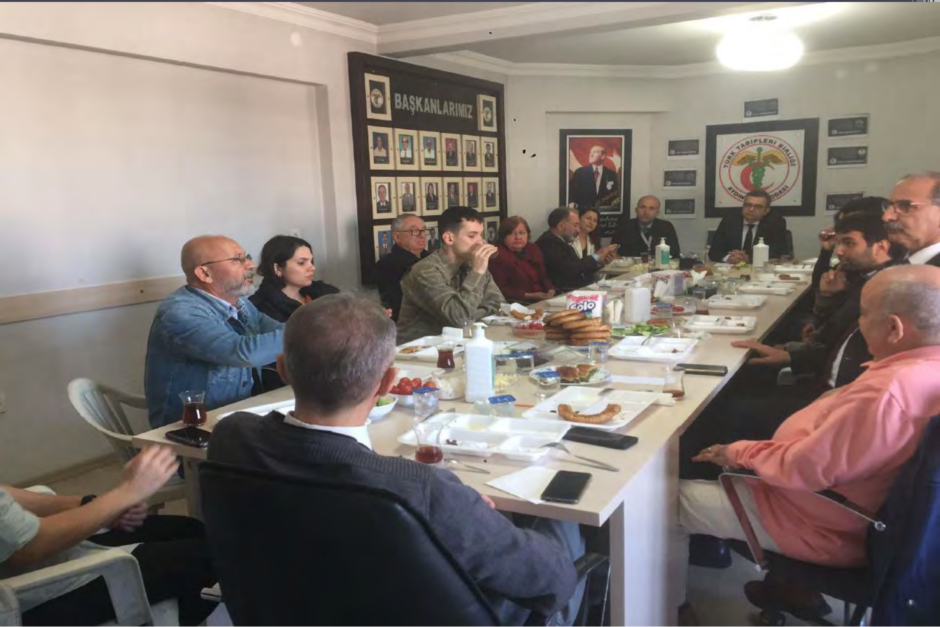
14 Mart Tıp Bayramında Depremzede öğrencilerle Kahvaltıda buluştuk