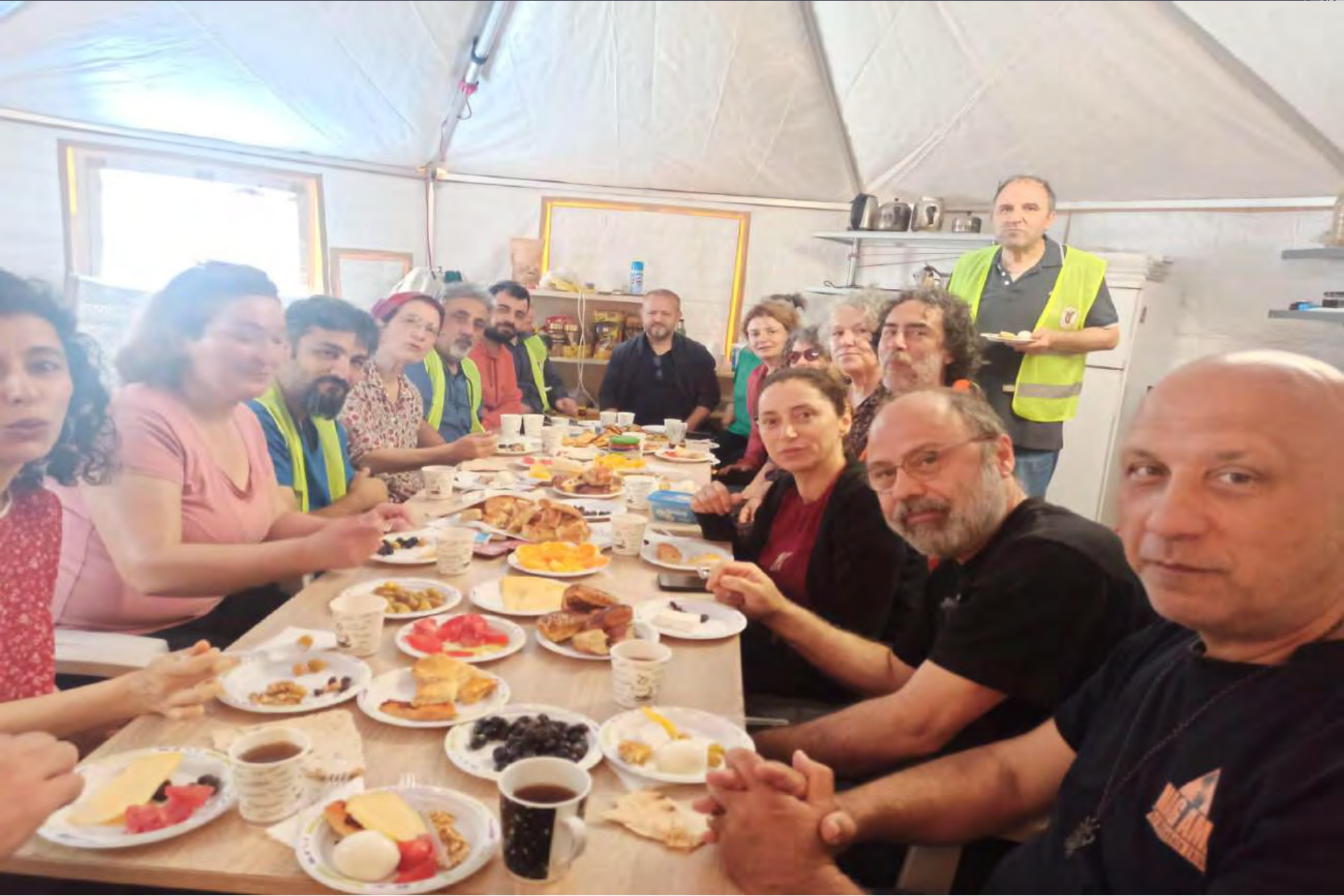
DEPREM BÖLGESİ ANTAKYA BAYRAM SABAHİ