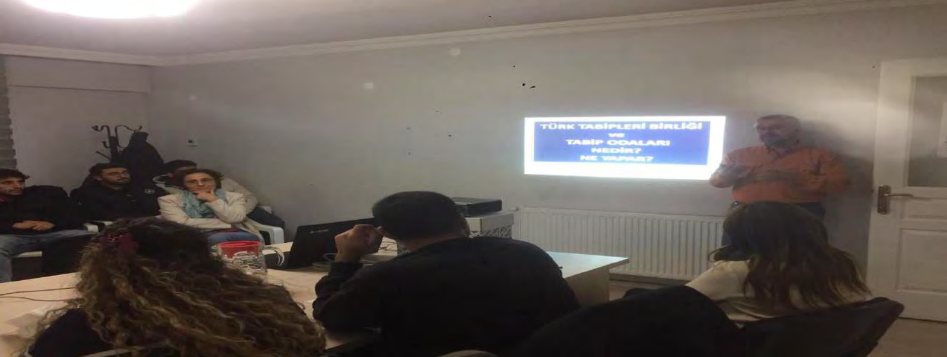
ADÜ TIP FAKÜLTESİ İNTERN ÖĞRENCİLERİ TABİP ODASI STAJLARI DEVAM EDİYOR