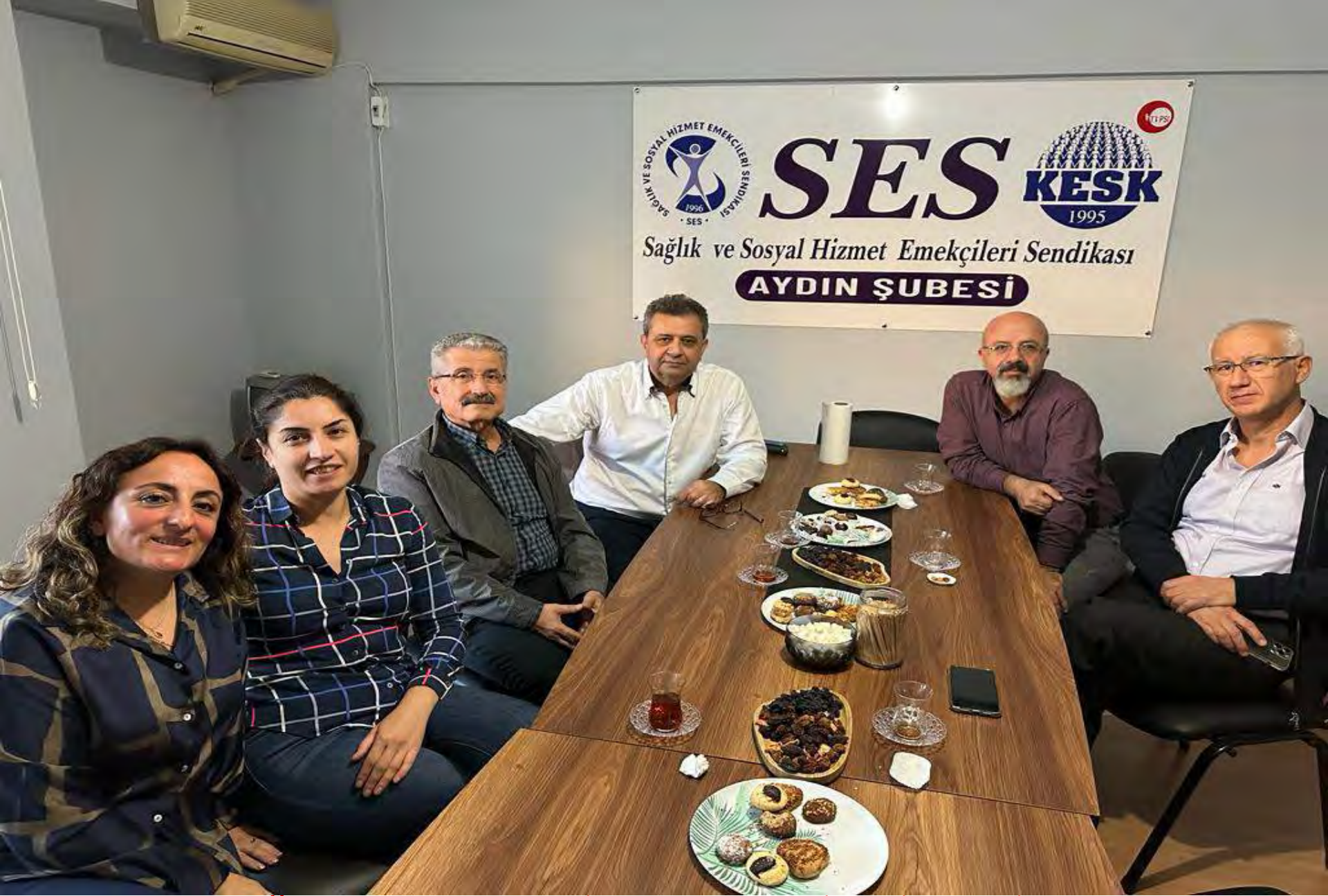
14 11 2024 SAĞLIK VE SOSYAL HİZMET EMEKÇİLERİ SENDİKASI ZİYARETİMİZ