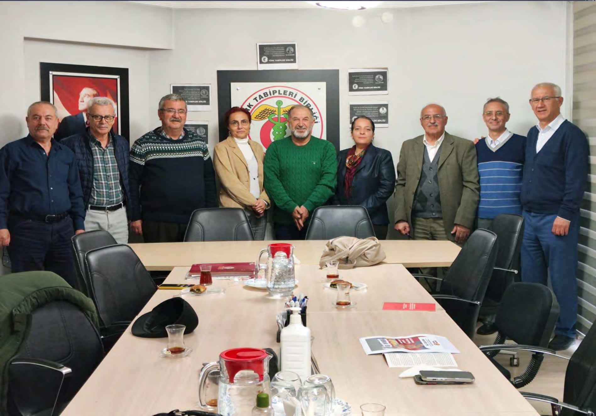
6 03 2024 EMEK PARTİSİ İL ÖRGÜTÜNÜN ODAMIZI ZİYARETİ