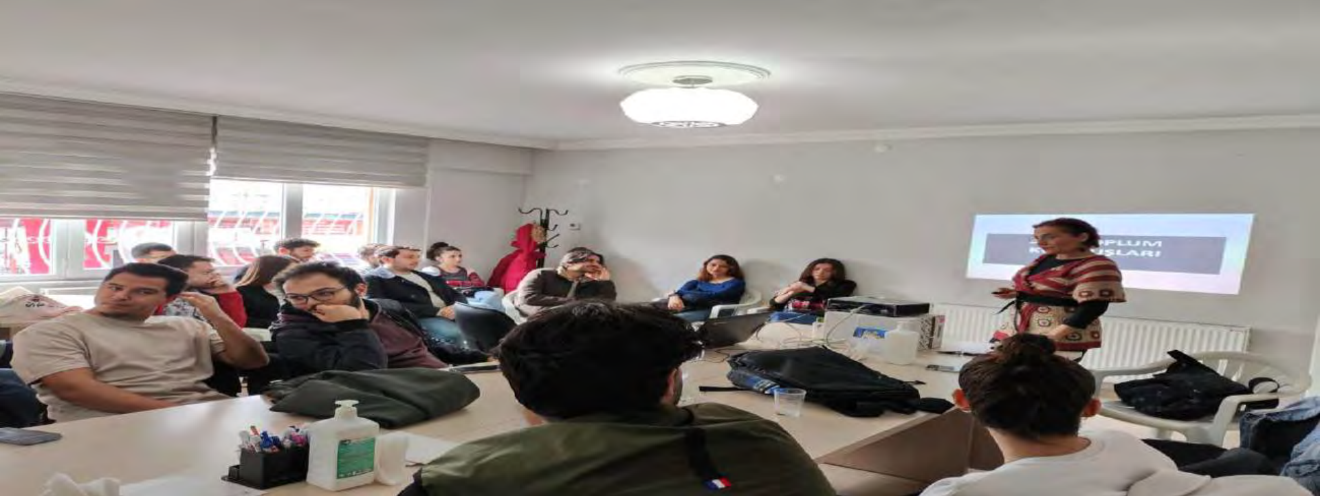
ADÜ TIP FAKÜLTESİ İNTERN ÖĞRENCİLERİ TABİP ODASI STAJLARI DEVAM EDİYOR