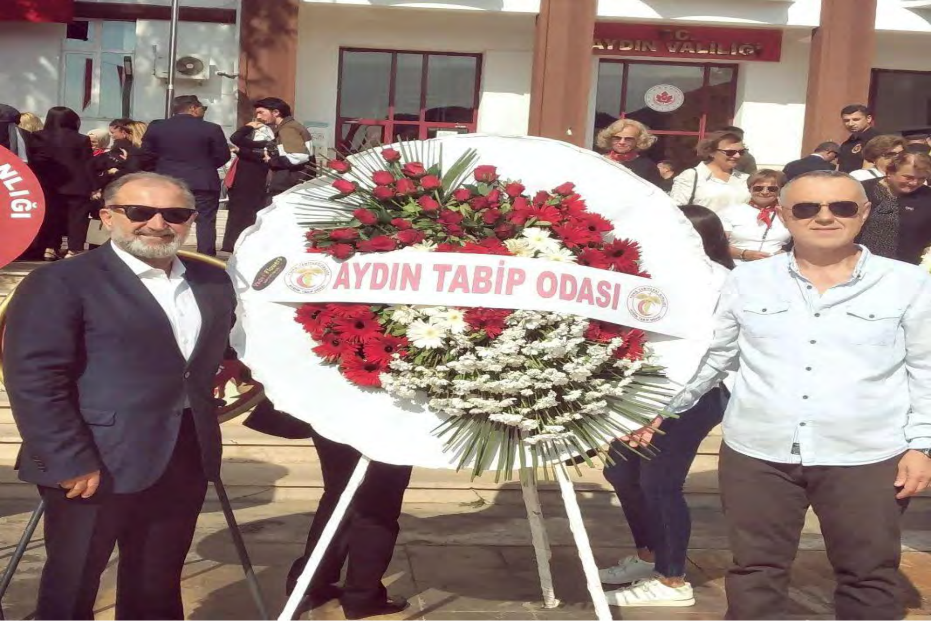
29 Ekim Cumhuriyet Bayramı çelenk kyma töreni