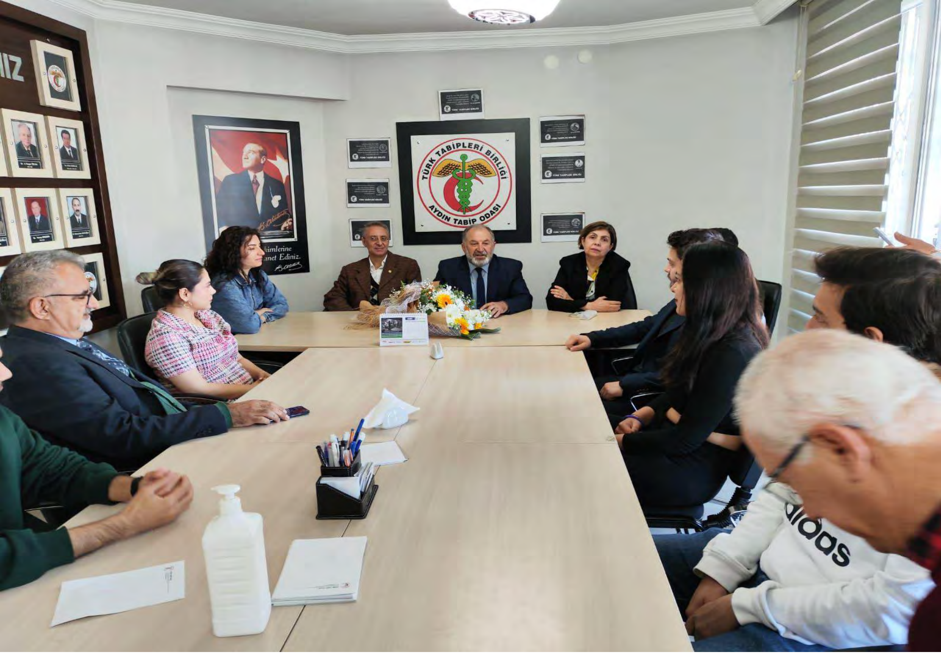
14 Mart Tıp Bayramı basın açıklaması