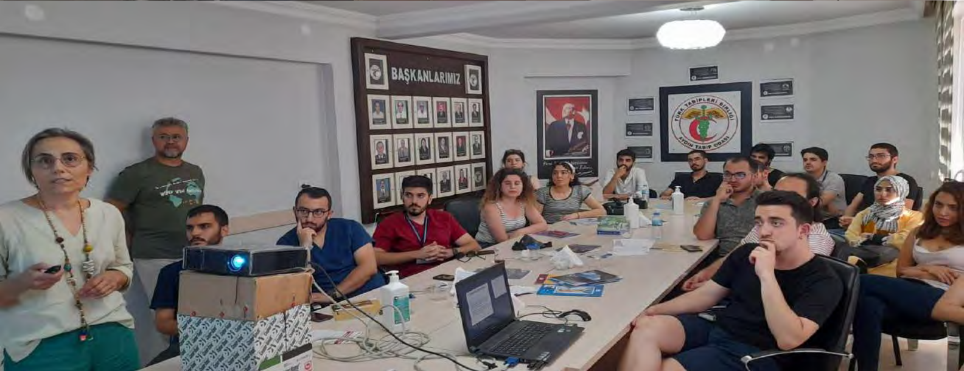
ADU TIP FAKULTESİ INTERN OĞRENCİLERİ TABİP ODASI STAJLARI DEVAM EDİYOR