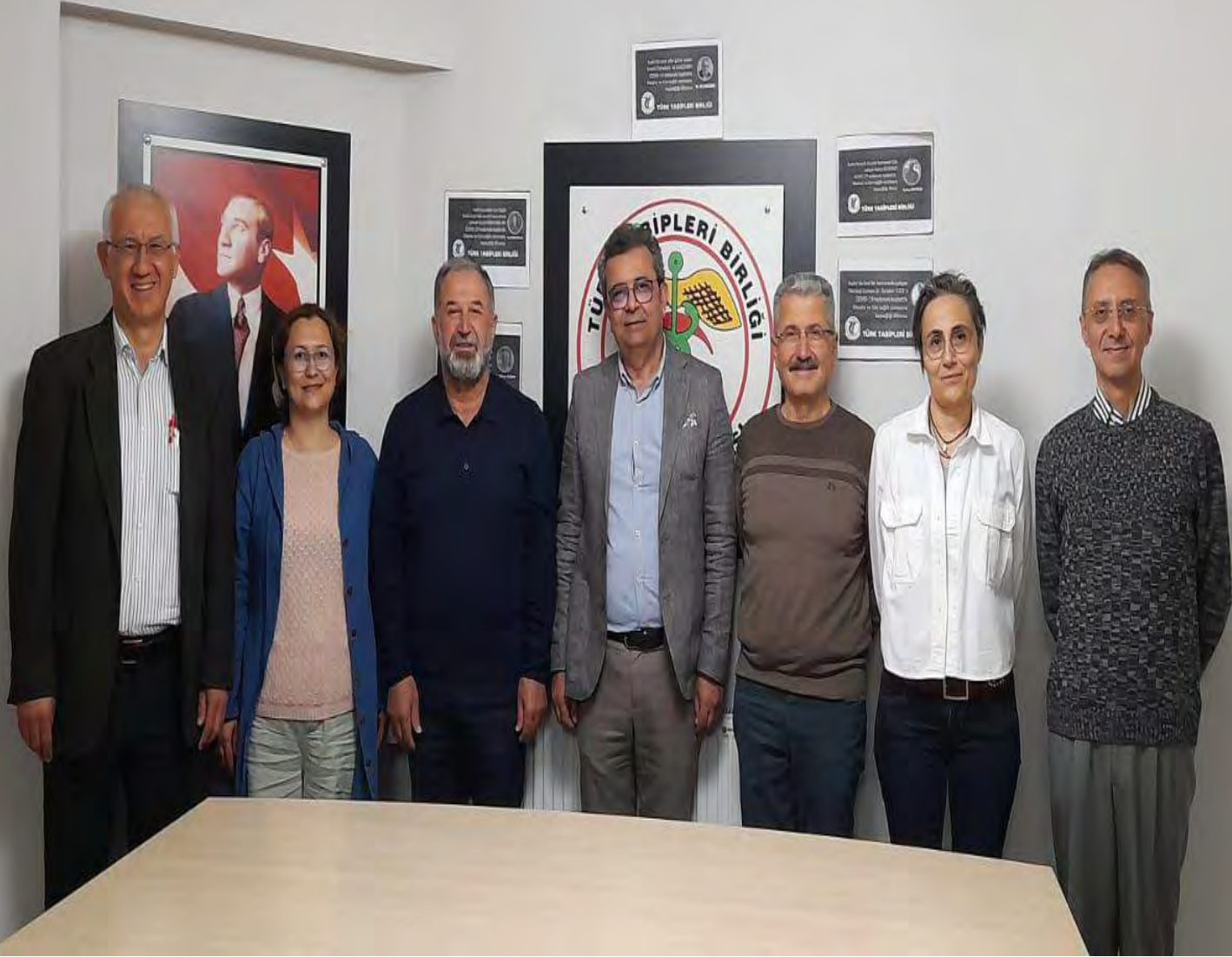
2022-2024 Dönemi Yönetim Kurulu üyeleri