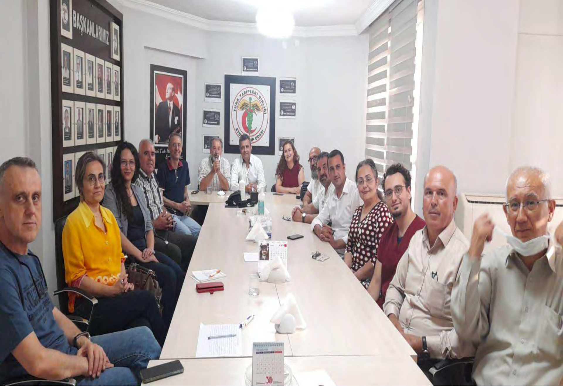
24.05.2022 KESK ŞUBELER PLATFORMUNUN ZİYARETİ