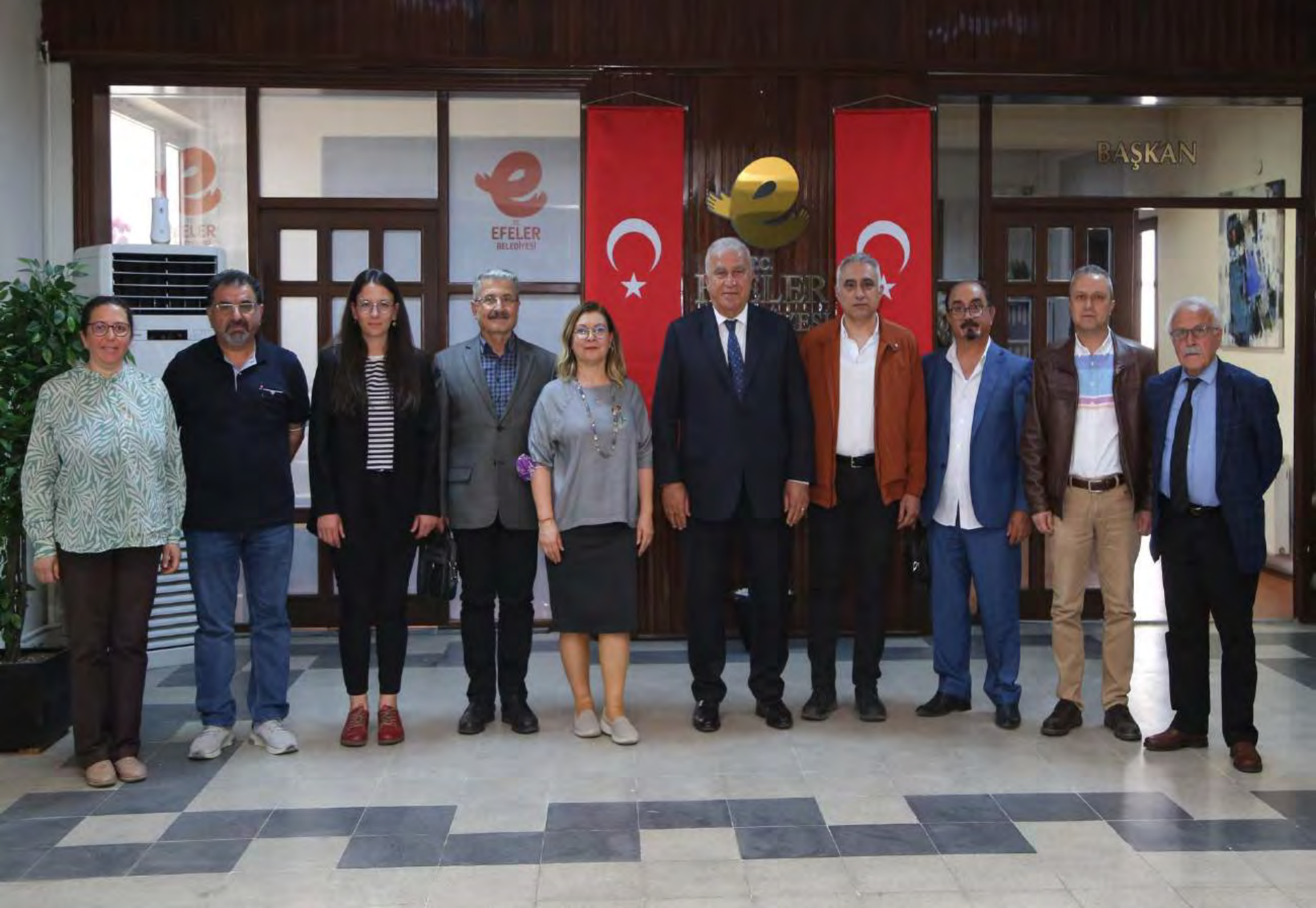
26.04.2022 1 MAYIS HAZIRLIK KOMİTESİ TOPLANTISI